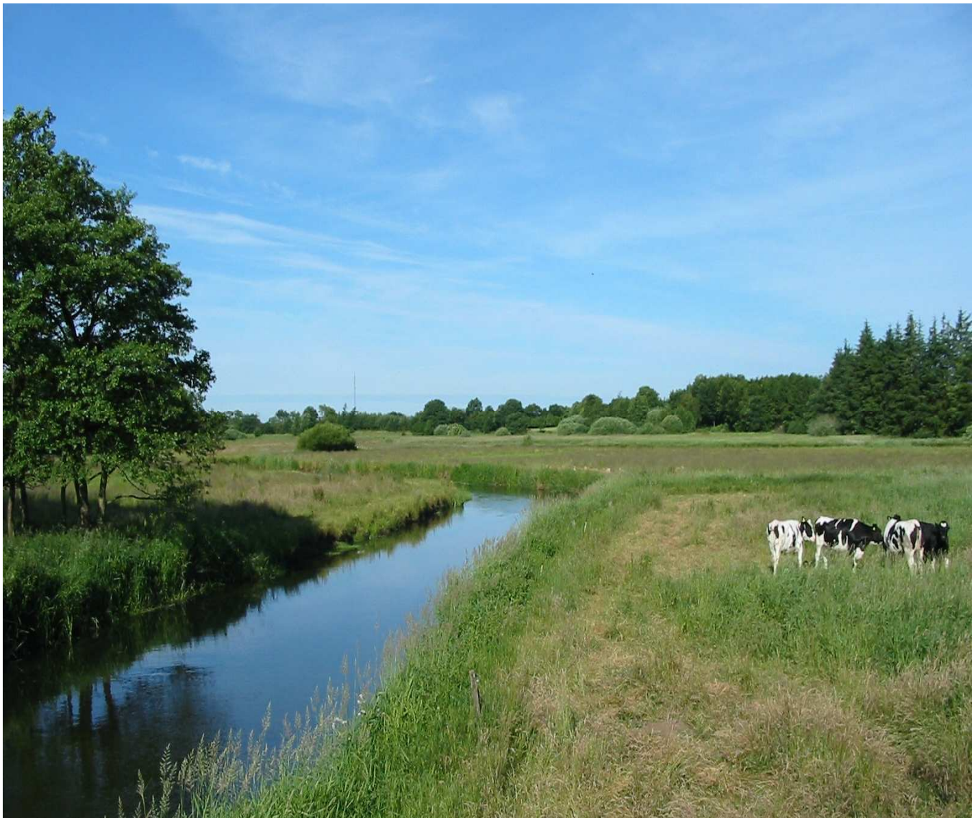
Kongeåen ved Skodborghus